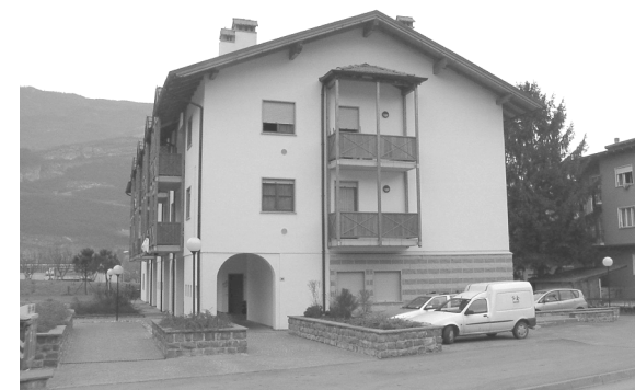
La sede legale e amministrativa